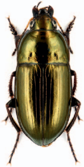
Abb. 4: Amara littorea .

konnten dagegen keine Konzentration der Art in Sphagnum -Rasen beobachten. In einem großen Moor- und Feuchtgebietskomplex in Baden-Württemberg, dem Federseeried, lebt die Art in höheren Individuenzahlen in Schilfgürteln, Seggenrieden und Flachmooren. In den vollständig von Torfmoos bedeckten Zwischenmoorstadien des Federseeriedes ist sie dagegen eher selten (WASNER 1977, 1979). A. gracile stellt hohe Ansprüche an die Wasserversorgung des Lebensraums und wurde im Untersuchungsgebiet ausschließlich am niedermoorartigen Seggensumpf (Rab E) nachgewiesen.