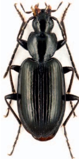
Abb. 3: Agonum gracile . Abbildung © Orthwin Bleich, http://eurocarabidae.de