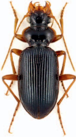
Abb. 6: Leistus rufomarginatus .