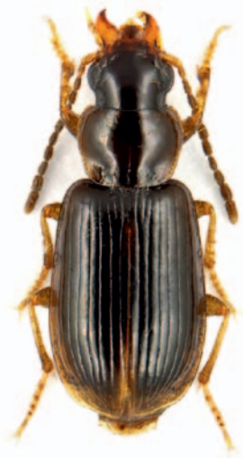
Abb. 2: Acupalpus exiguus .

Agonum gracile (Abb. 3) wird von einigen Autoren als Art mit Verbreitungsschwerpunkt in Hochmooren, Flachmooren und vegetationsreichen Ufern beschrieben (BARNER 1954, GERSDORF 1937, LINDROTH 1945, PEUS 1928, 1932). Die Affinität zu Lebensräumen mit dichten Sphagnum -Beständen heben dabei z.B. RABELER (1931) aber auch PEUS (1928, 1932) und BARNER (1954) hervor. Andere Autoren