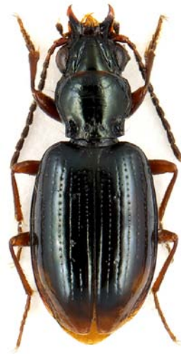
Abb. 5: Bembidion doris .

Amara littorea (Abb. 4) ist eine in Europa weit verbreitete Art. Ihr Verbreitungsschwerpunkt liegt in Osteuropa. Im Westen wird sie deutlich seltener nachgewiesen. Sie ist in der Ebene und im mittleren Bergland anzutreffen und bevorzugt Wiesen und Äcker auf leichten bis mittelschweren Böden, die einen gewissen Feuchtigkeitsgehalt aufweisen (MÜLLER-MOTZFELD 2006). A. littorea wurde im Untersuchungsgebiet an einer quellig-wechselfeuchten Streuwiese (Rab A) nachgewiesen. Der Fund im Nationalpark ist der dritte Nachweis der Art in Hessen (TRAUTNER et al. 2014, Malten & Schmidt in litt.).