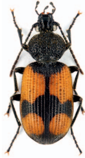
Abb. 7: Panagaeus cruxmajor .

BURMEISTER 1939, KOCH 1968, LINDROTH 1945, LOHSE 1954). P. cruxmajor wurde im Untersuchungsgebiet in den wechsellrockenen Randbereichen einer Streuwiese (Rab B) nachgewiesen.